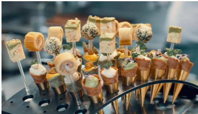
Apero, Bankette oder